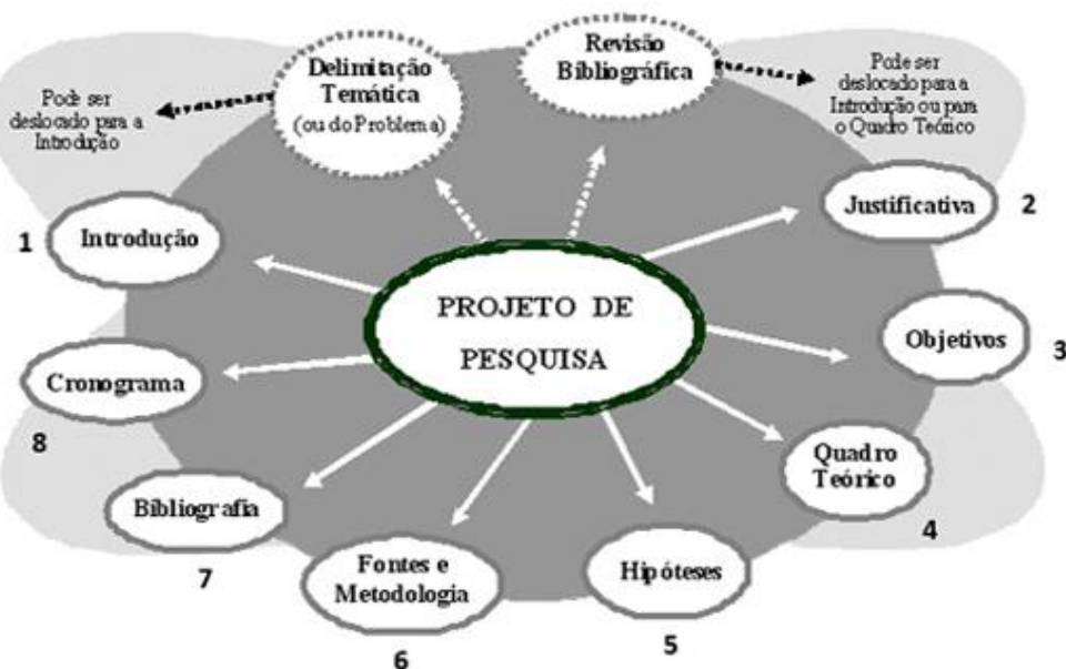
Quadro 2: As partes de um Projeto de Pesquisa

Fonte: https://revistatemalivre.com/tag/como-fazer-um-projeto-de-pesquisa